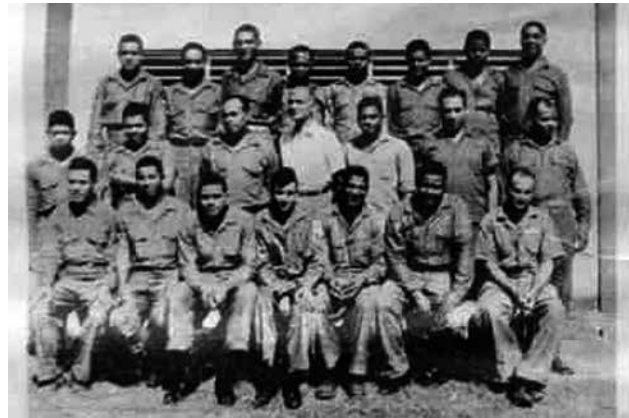
Segunda promoción de la Escuela Vocacional.

Planificar, ejecutar, supervisar y evaluar los programas técnicos educativos tendentes a consolidar la formación técnica profesional.