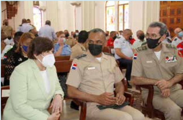
MIDE y DIGEV celebran 55 Aniversario P. 28 y 29