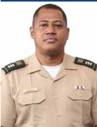
San Familia Díaz Capitan Contador ERD Subdirector de Compras