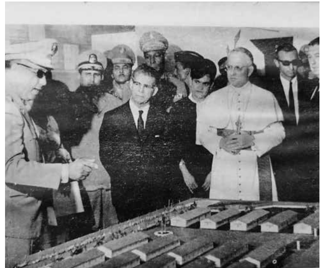
Plano de la primera Escuela Vocacional.

Un trabajo tenaz por parte de los miembros de las Fuerzas Armadas y de la Policía Nacional hizo posible que el 14 de Octubre de 1966, el gobierno del doctor Joaquín Balaguer inaugurara el primer recinto en el municipio de Baní, provincia Peravia, constituyéndose esto en un paso trascen-