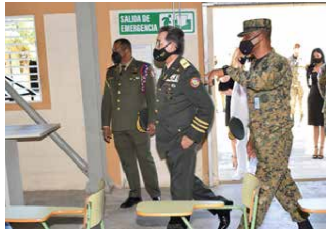
Ministro de Defensa, Teniente General ERD, Carlos Díaz Morfa, visita instalaciones de la Escuela Vocacional del municipio Santo Domingo Este.

Entre las visitas recibidas durante estos 14 meses de gestión, figuran la realizada por el Teniente General del Ejército de la República Dominicana (ERD), Carlos Luciano Díaz Morfa; quien ponderó el arduo trabajo de transformación y modernización que está llevando a cabo la actual gestión que encabeza el General de Brigada Otaño Jiménez al frente de esas escuelas.