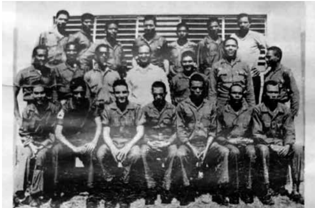
Primera promoción de la Escuela Vocacional.

en las diferentes Escuelas Vocacionales distribuidas en toda la geografía nacional.