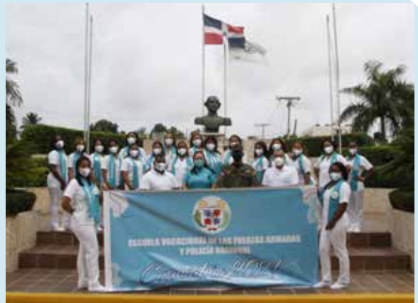
Egresados se colocan con rapidez en el mercado laboral P. 24 y 25