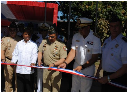
Escuela Vocacional San Cristóbal