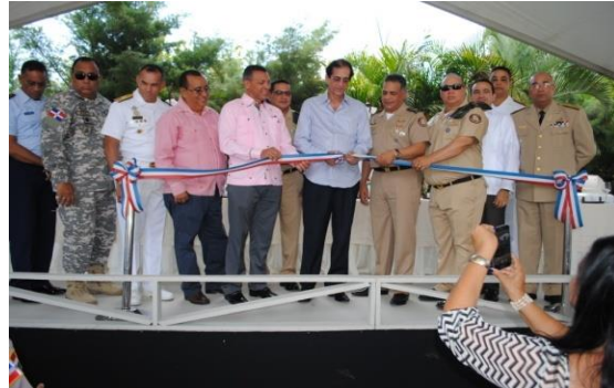
Escuela Vocacional San José de las Matas