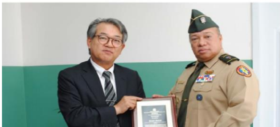
Donación del Gobierno Japonés de Modernas Maquinarias de Control Numérico Computarizado - CNC.