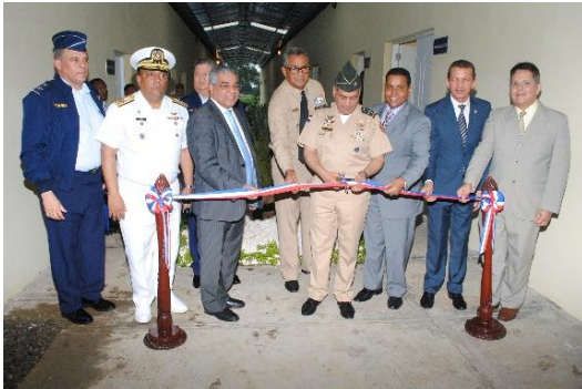
Escuela Vocacional Castillo